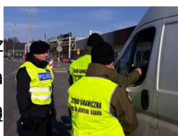
kontrola na szlakach komunikacyjnych

Kilkanaście lat temu Straż Graniczna kojarzona była głównie z fizyczną ochroną granicy i kontrolą ruchu granicznego. Jednak na skutek zmian jakie nastąpiły po przyłączeniu Polski najpierw do Unii Europejskiej, a potem do Układu z Schengen, z formacji typowo granicznej, Straż Graniczna została przekształcona w nowoczesną, dobrze wyposażoną służbę graniczno-migracyjną działającą na obszarze całego kraju.