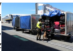
kontrola bagaży na lotnisku