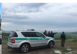
udział w misjach zagranicznych