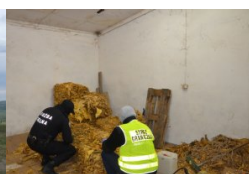
nielegalna krajanka tytoniowa