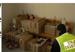
alkohol bez polskich znaków akcyzy skarbowej