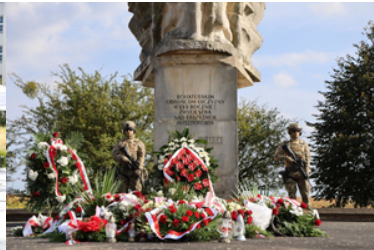
Uroczyste obchody upamiętniające 85. rocznicę wybuchu II wojny światowej