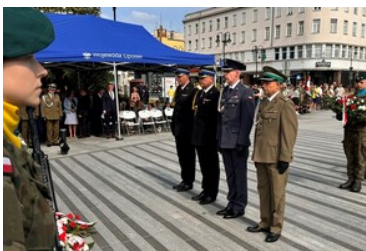
Uroczyste obchody upamiętniające 85. rocznicę wybuchu II wojny światowej