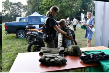
Uroczyste obchody upamiętniające 85. rocznicę wybuchu II wojny światowej