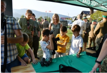
Uroczyste obchody upamiętniające 85. rocznicę wybuchu II wojny światowej