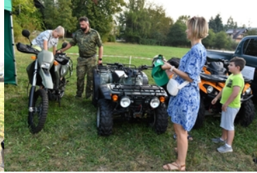
Uroczyste obchody upamiętniające 85. rocznicę wybuchu II wojny światowej