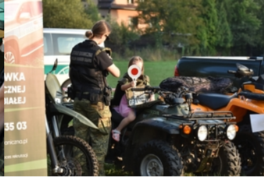
Uroczyste obchody upamiętniające 85. rocznicę wybuchu II wojny światowej