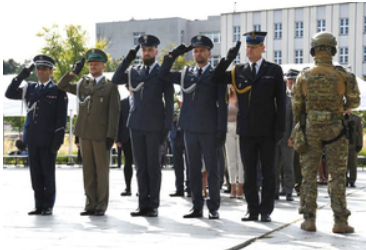
Uroczyste obchody upamiętniające 85. rocznicę wybuchu II wojny światowej