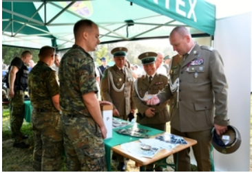
Uroczyste obchody upamiętniające 85. rocznicę wybuchu II wojny światowej