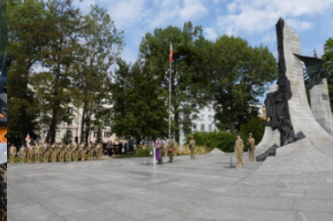
Uroczyste obchody upamiętniające 85. rocznicę wybuchu II wojny światowej