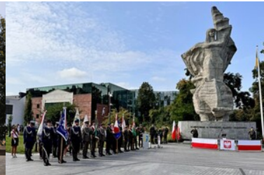
Uroczyste obchody upamiętniające 85. rocznicę wybuchu II wojny światowej