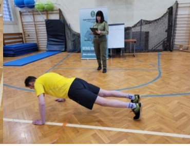
Drugi etap postępowania kwalifikacyjnego w Śląskim Oddziale Straży Granicznej