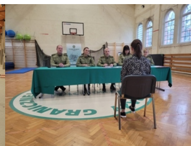
Drugi etap postępowania kwalifikacyjnego w Śląskim Oddziale Straży Granicznej