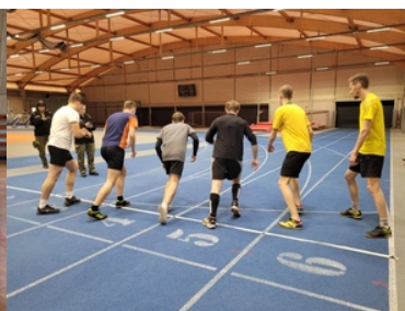
Drugi etap postępowania kwalifikacyjnego w Śląskim Oddziale Straży Granicznej