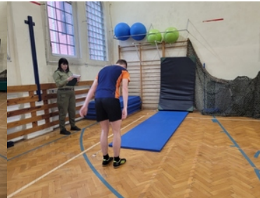
Drugi etap postępowania kwalifikacyjnego w Śląskim Oddziale Straży Granicznej