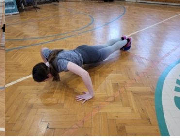
Drugi etap postępowania kwalifikacyjnego w Śląskim Oddziale Straży Granicznej