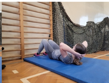
Drugi etap postępowania kwalifikacyjnego w Śląskim Oddziale Straży Granicznej