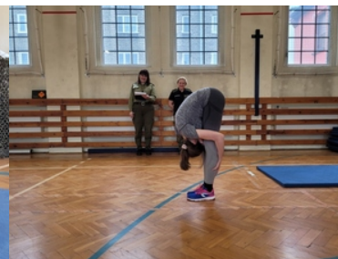
Drugi etap postępowania kwalifikacyjnego w Śląskim Oddziale Straży Granicznej