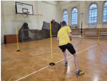
Drugi etap postępowania kwalifikacyjnego w Śląskim Oddziale Straży Granicznej