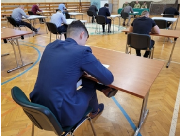
Drugi etap postępowania kwalifikacyjnego w Śląskim Oddziale Straży Granicznej