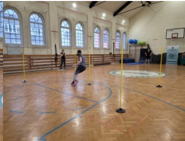
Drugi etap postępowania kwalifikacyjnego w Śląskim Oddziale Straży Granicznej