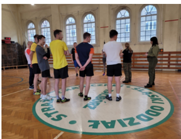
Drugi etap postępowania kwalifikacyjnego w Śląskim Oddziale Straży Granicznej