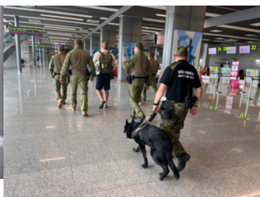
Funkcjonariusze SG prowadzą mężczyznę