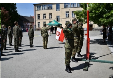
Uroczyste ślubowanie uczniów klas pierwszych o profilu Straży Granicznej