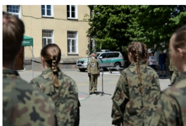
Uroczyste ślubowanie uczniów klas pierwszych o profilu Straży Granicznej