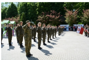
Uroczyste ślubowanie uczniów klas pierwszych o profilu Straży Granicznej