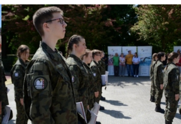
Uroczyste ślubowanie uczniów klas pierwszych o profilu Straży Granicznej