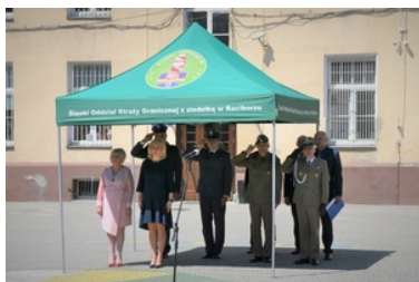
Uroczyste ślubowanie uczniów klas pierwszych o profilu Straży Granicznej

rekrutację uczniów chcących podjąć kształcenie w klasie o profilu Straży Granicznej w roku szkolnym 2022/2023.