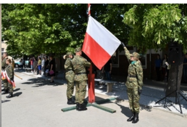
Uroczyste ślubowanie uczniów klas pierwszych o profilu Straży Granicznej