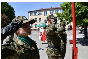
Uroczyste ślubowanie uczniów klas pierwszych o profilu Straży Granicznej