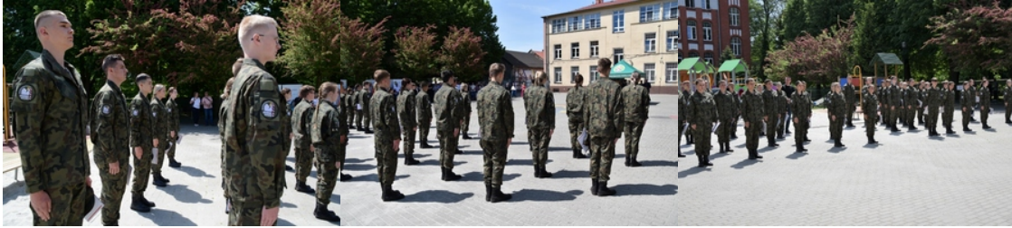
Uroczyste ślubowanie uczniów klas pierwszych o profilu Straży Granicznej