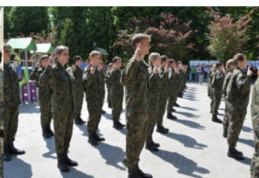
Uroczyste ślubowanie uczniów klas pierwszych o profilu Straży Granicznej