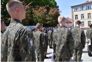
Uroczyste ślubowanie uczniów klas pierwszych o profilu Straży Granicznej