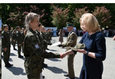
Uroczyste ślubowanie uczniów klas pierwszych o profilu Straży Granicznej