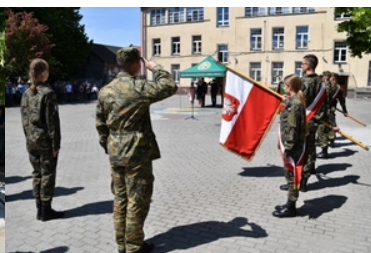
Uroczyste ślubowanie uczniów klas pierwszych o profilu Straży Granicznej