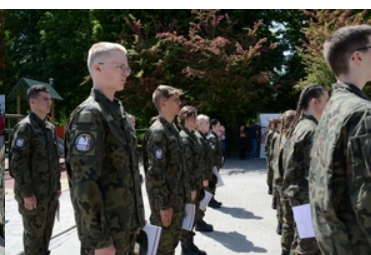
Uroczyste ślubowanie uczniów klas pierwszych o profilu Straży Granicznej