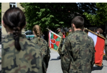
Uroczyste ślubowanie uczniów klas pierwszych o profilu Straży Granicznej