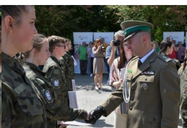
Uroczyste ślubowanie uczniów klas pierwszych o profilu Straży Granicznej