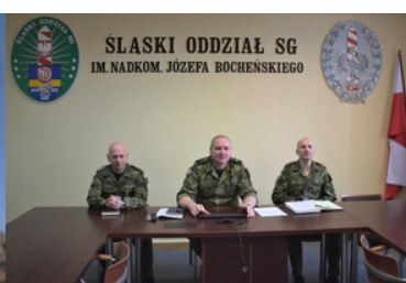
Komendant ŚIOSG oraz jego zastępcy