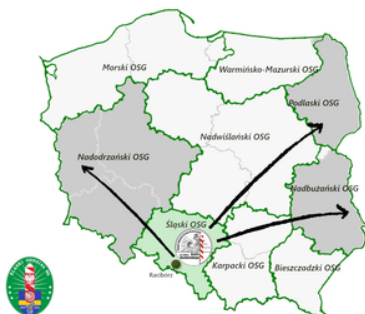
Poglądowa mapka działania funkcjonariuszy ŚIOSG na terenie Polski