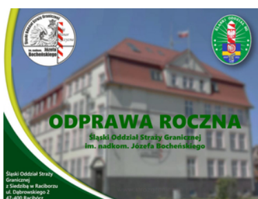
Śląski Oddział Straży Granicznej

Na zakończenie odprawy Komendant Oddziału postawił priorytetowe zadania i wytyczne na bieżący rok, pełen wyzwań związanych ze zintensyfikowanymi działaniami Straży Granicznej w obliczu konfliktu zbrojnego na terenie Ukrainy. Komendant podziękował także funkcjonariuszom za wysiłek i wkład włożony w realizację zadań służbowych w minionym roku.