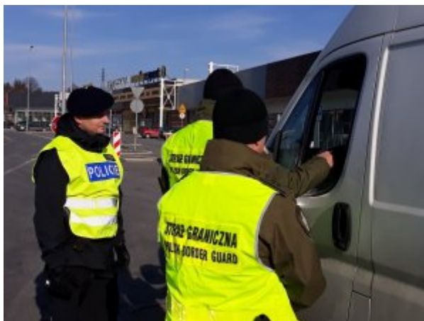
kontrola na szlakach komunikacyjnych

By móc egzekwować przepisy prawa oraz zapewnić bezpieczeństwo i porządek publiczny w warunkach braku kontroli granicznej oraz skutecznie rozpoznawać i przeciwdziałać zjawiskom przestępczym towarzyszącym otwarciu granic, konieczne było wprowadzenie zmian, które umożliwiałyby realizowanie tych zadań w głębi kraju. Dlatego też w działaniu granicy wewnętrznej – w tym Śląskiego Oddziału Straży