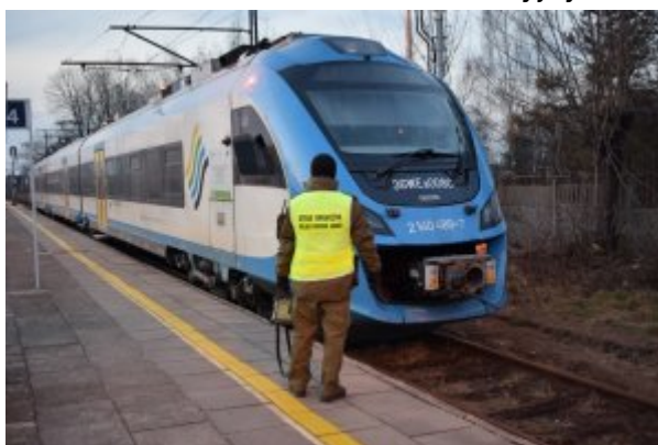
kontrola na dworcach kolejowych