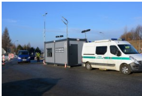
tymczasowe przywrócenie kontroli granicznej w Cieszynie

W zasięgu terytorialnym Śląskiego Oddziału Straży Granicznej zostało wyznaczonych 99 miejsc (na terenie województwa śląskiego - 62, na terenie województwa opolskiego -