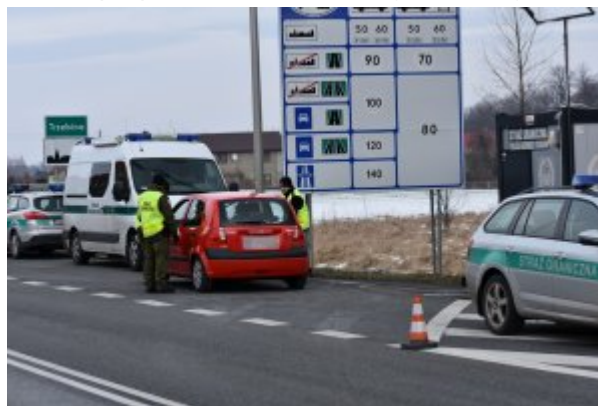
tymczasowe przywrócenie kontroli granicznej w Trzebnii