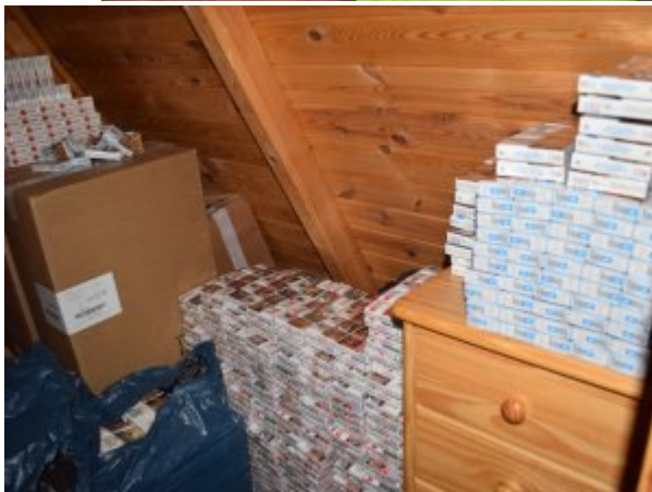
papierosy bez polskich znaków skarbowych akcyzy