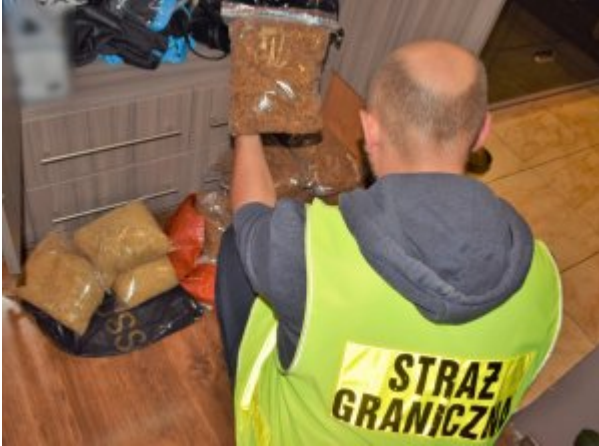
ujawniona krajanka tytoniowa