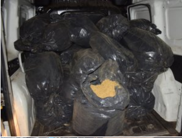
ujawniona krajanka tytoniowa